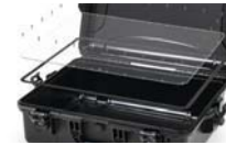
Ensemble de panneau étanche