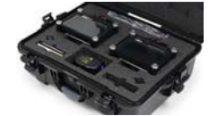
Mousse coupée sur mesure