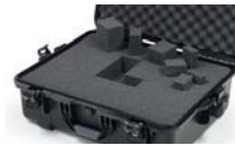
Calages de mousse cubique