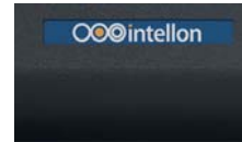
Étiquette autocollante personnalisée