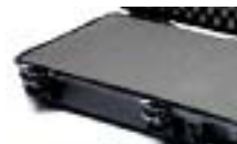
Calages de mousse