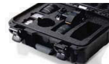
Mousse coupée sur mesure